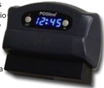
TCA9100 Terminal RFID

Registre entradas y salidas de sus empleados por medio de tarjetas de proximidad y la terminal de asistencia TCA9100. Cuenta con todo lo necesario para la instalación mínima y puesta en marcha de la terminal. Incluye el software POS-time.