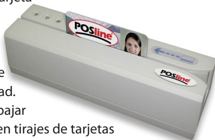
GM2250 Lector y Grabador Magnético

El modelo GM2250 posee la doble función de leer y escribir información en los 3 tracks que posee una tarjeta magnética. Su cabeza de lectura es de gran durabilidad y permite leer y grabar tarjetas de alta y baja coercitividad. Está diseñado para trabajar en ambientes rudos y en tirajes de tarjetas altos. Incluye un software que permite definir los datos a grabar en la tarjeta.