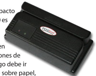
LC2300 Slot Código de Barras

De alta resistencia al impacto y a la humedad, el LC2300 es la solución en control de acceso y kioscos de autoservicio. Disponible en luz infraroja para aplicaciones de seguridad donde el código debe ir oculto (banda negra). Lee sobre papel, cartón o plástico.