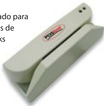
LM2200 Slot Magnético

El lector LM2200 está diseñado para Punto de Venta y aplicaciones de escritorio. Lee hasta dos tracks de información con un solo deslizamiento en cualquier dirección. Es programable y puede dividir, reacomodar, editar o validar datos de la tarjeta magnética.